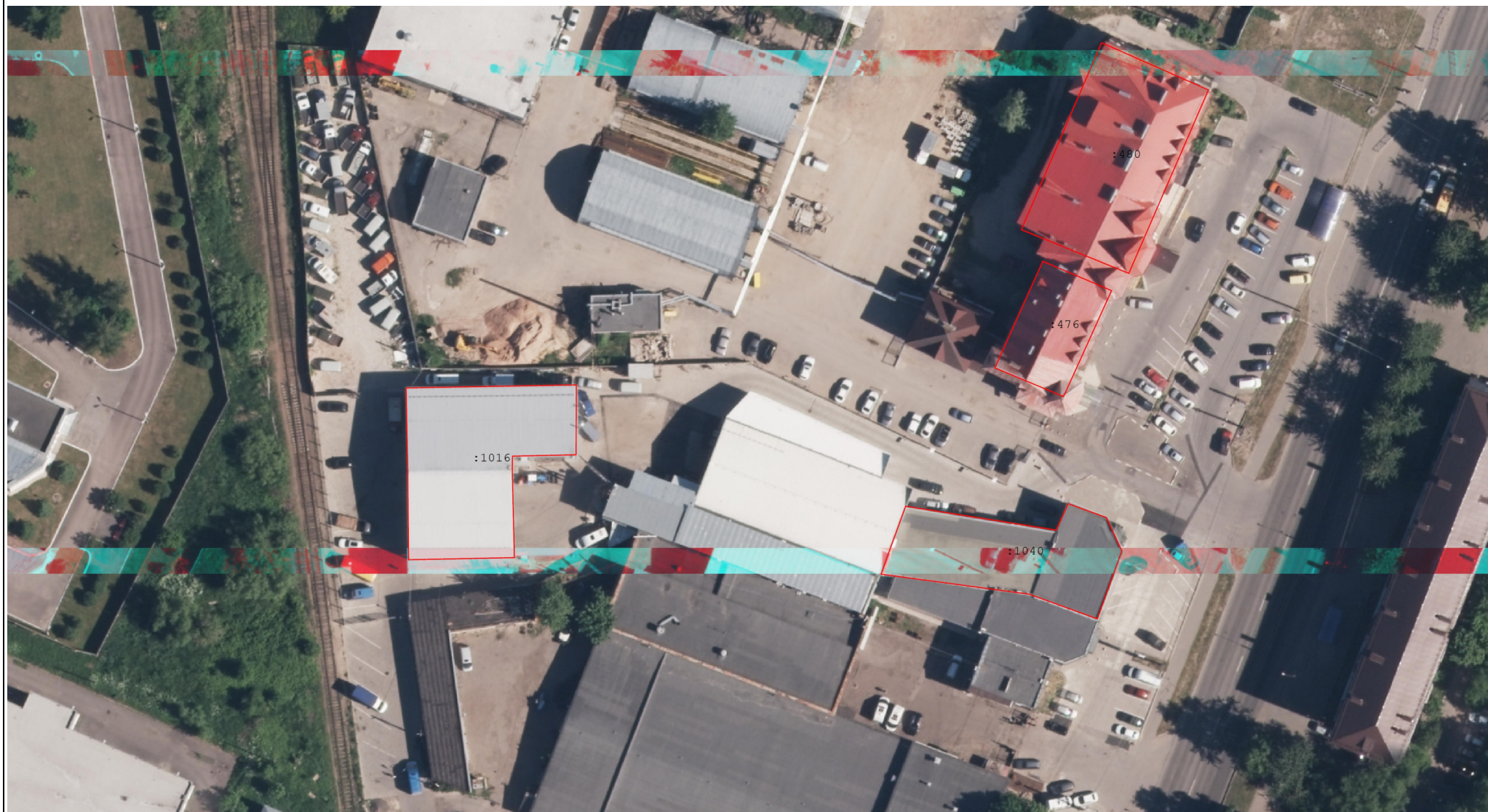
Схема границ земельных участков