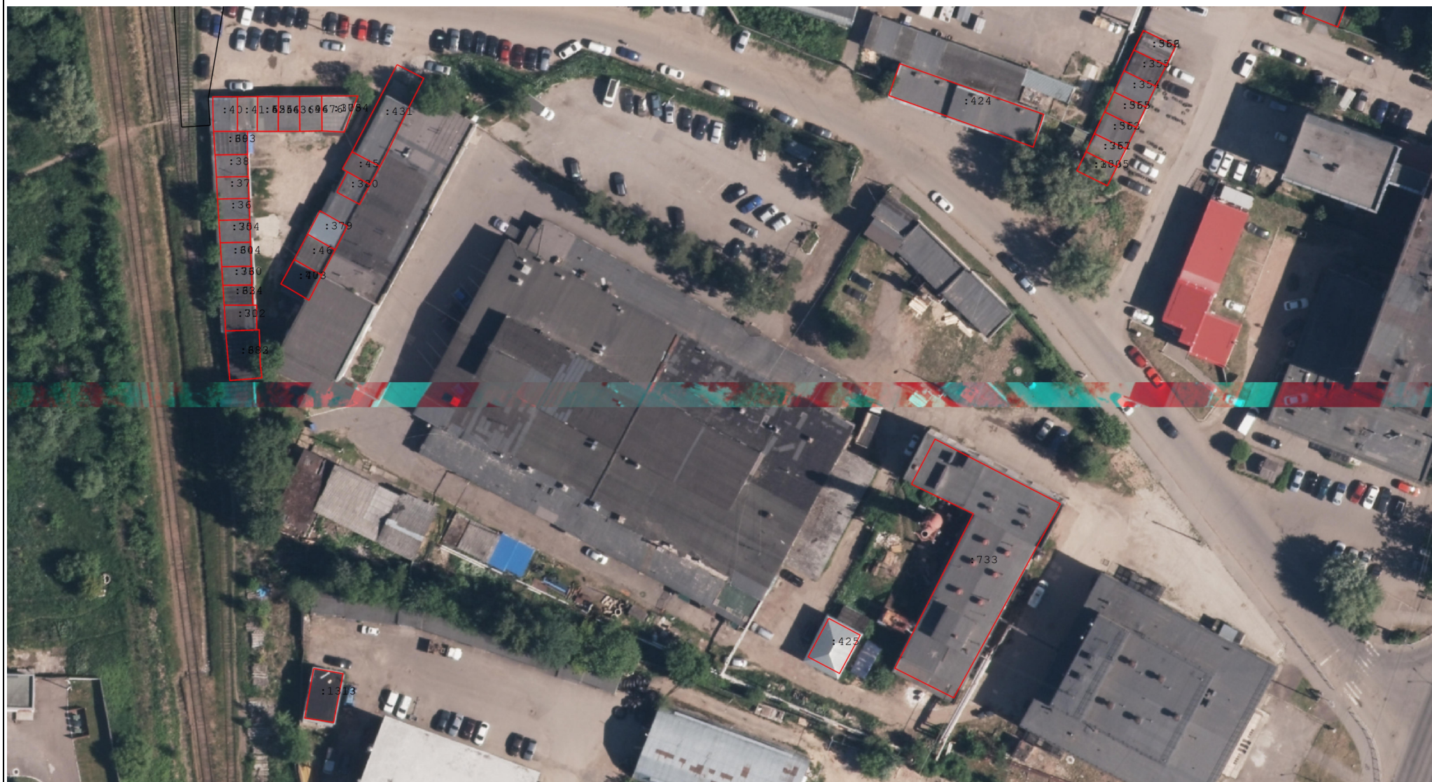
Схема границ земельных участков