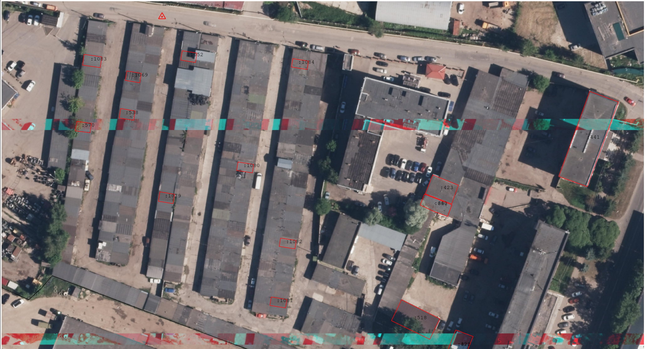
Схема границ земельных участков