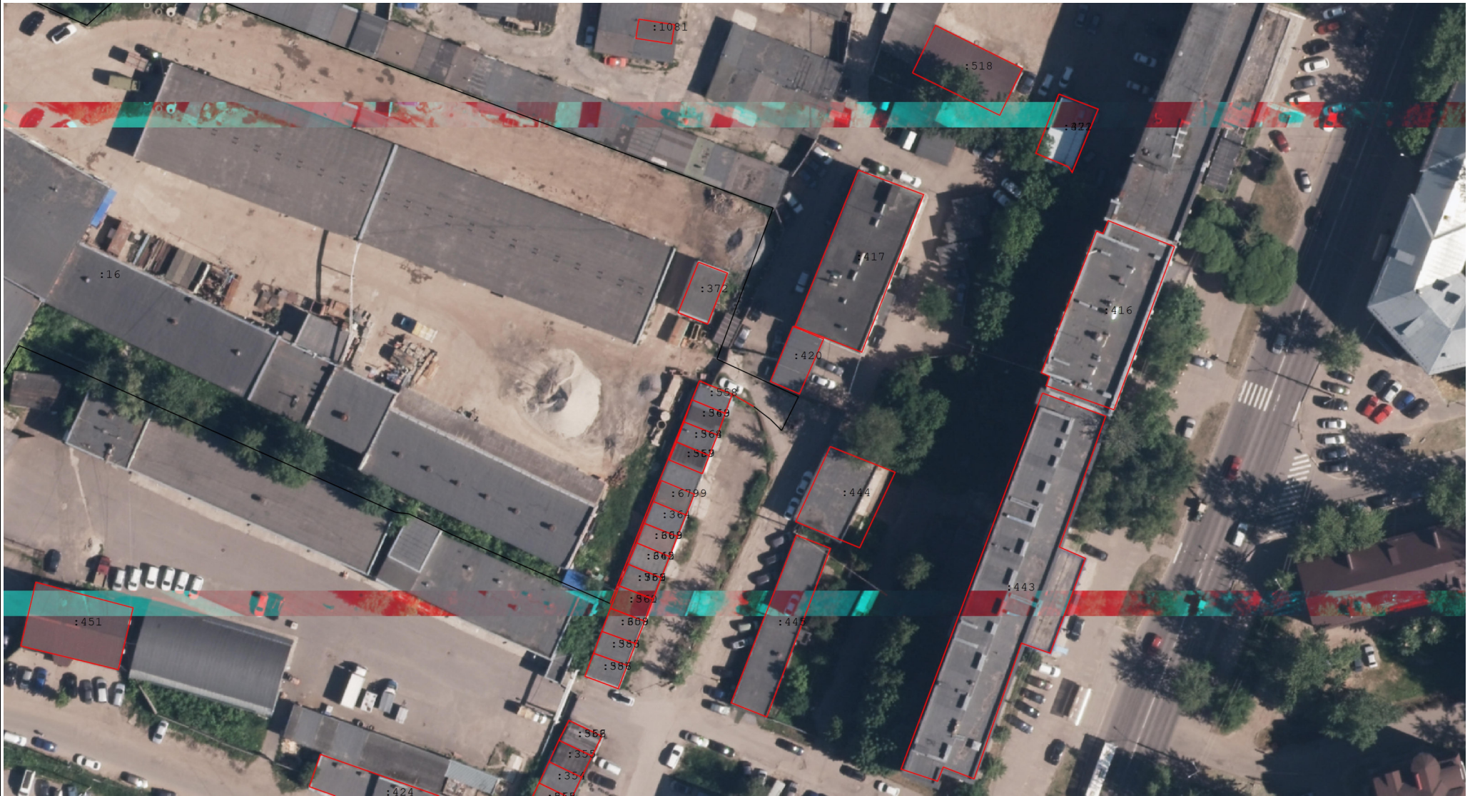
Схема границ земельных участков