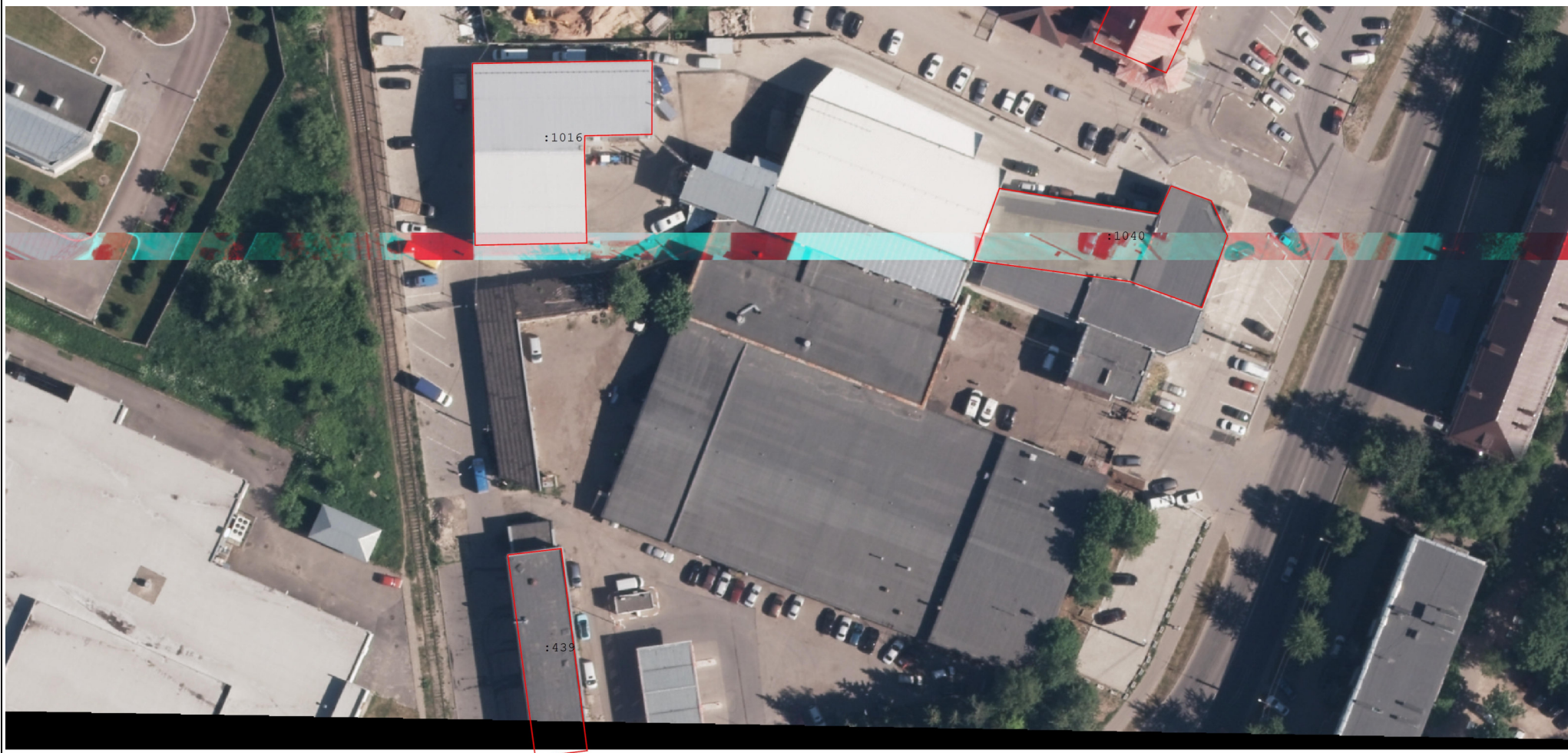
Схема границ земельных участков